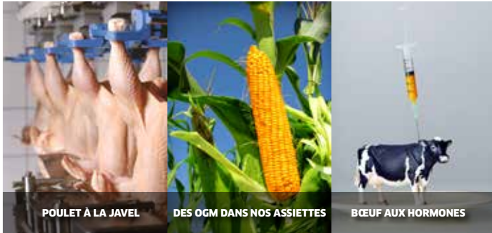
POULET À LA JAVEL